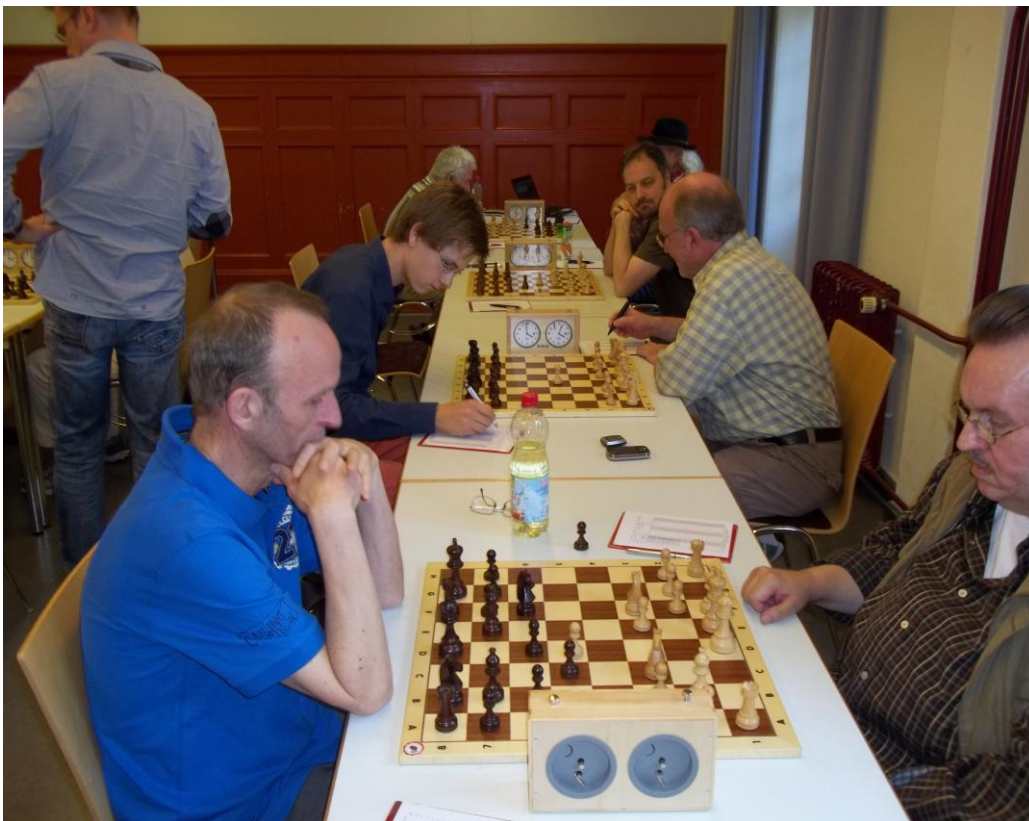
Blick in den Turniersaal. Im Vordergrund das Finale. (Bericht und Bilder: Max-Günter Raimann)